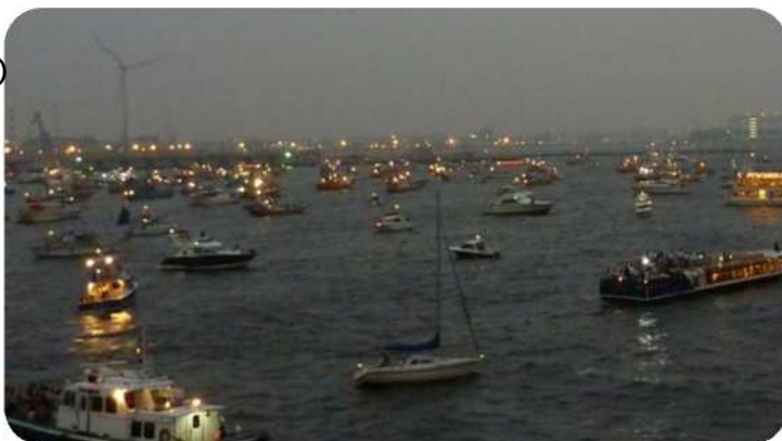
<参考> 花火大会を観覧する多数の船舶

「見張り不十分」 による 「衝突・乗揚」 観覧終了後 「帰港中」 の事故が多数を占めています