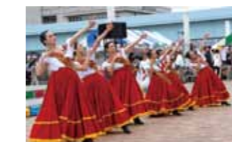
フィエスタ・メヒカーナ in ODAIBA TOKYO