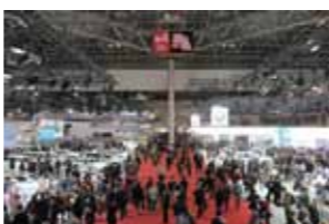
東京モーターショー 2011