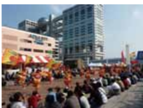
ドリーム夜さ来い祭り

臨海副都心の秋の風物詩のイベント。全国 100 チーム、7,000 人が舞い踊ります。