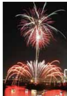
お台場レインボー花火2011